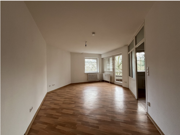
Zimmer 2 (1)