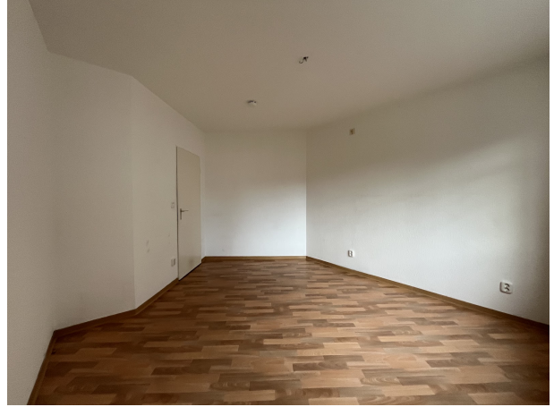
Zimmer 1 (2)