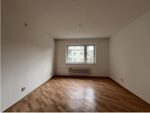
Zimmer 1 (1)